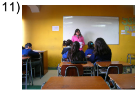
you guys guide