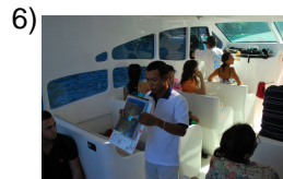
you all guide