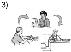
you guys place