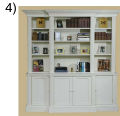
bookcase or shelves