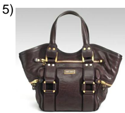
the bag, purse