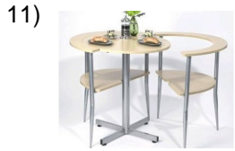
the little table