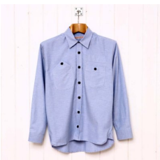
formal dress shirt