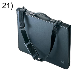
purse, pocket-book, portfolio