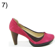
some short heeled shoes