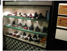
footwear, shoe shop