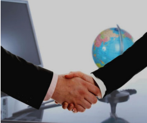
nice to meet you