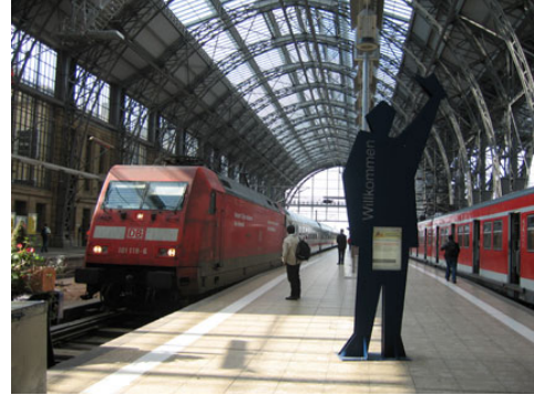
bus or train station