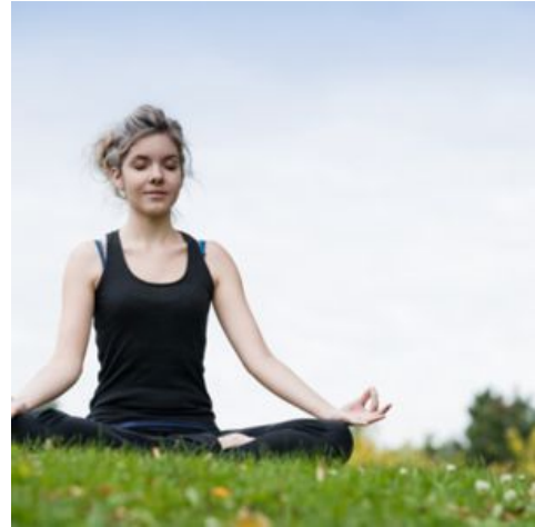
I feel very good