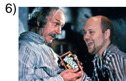
you guys send