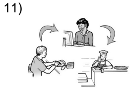
you guys place