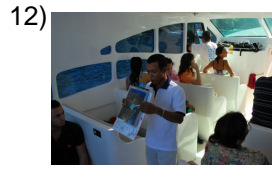
you all guide