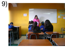
you guys guide

Words to Match: Paraguay - vosotros situáis - vosotros enviáis - enviáis - guau - estudiáis - Uruguay - despreciáis - buey - vosotros guiáis - situáis - guiáis - guayaba