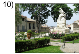
you all place