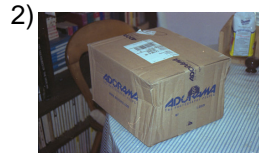
you all send