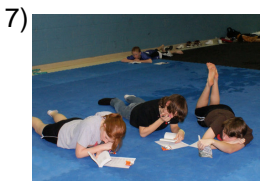
you all study