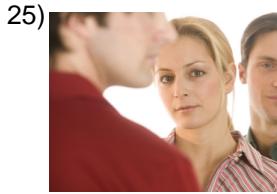
sexual harassment _____

Words to Match: jurisprudencia - violación - acoso sexual - robar - cooperar - acusado - evidencia - abogado acusador - pleito - asistente legal - daños y perjuicios - declararse - notificación - condenar - testificar - forense - inocente - alguacil - fiscal - contrabandista - la ley - chantajear - la querellante - detener - el delegado - los policías - demanda de divorcio - acuerdo de conciliación - permiso de trabajo - vándalo - hacer cumplir - incendio premeditado