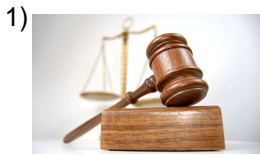
body of law

Words to Match: jurisprudencia - violación - acoso sexual - robar - cooperar - acusado - evidencia - abogado acusador - pleito - asistente legal - daños y perjuicios - declararse - notificación - condenar - testificar - forense - inocente - alguacil - fiscal - contrabandista - la ley - chantajear - la querellante - detener - el delegado - los policías - demanda de divorcio - acuerdo de conciliación - permiso de trabajo - vándalo - hacer cumplir - incendio premeditado