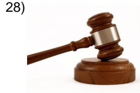
lawsuit for divorce _____