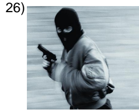
to rob, to steal _____