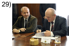
conciliation agreement _____