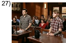
the plaintiff (female) _____