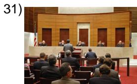
prosecuting attorney _____