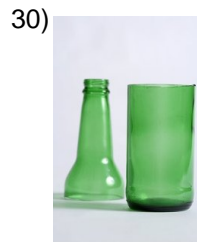
the bottle, jar