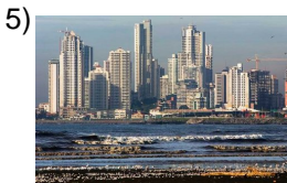
bigger and bigger