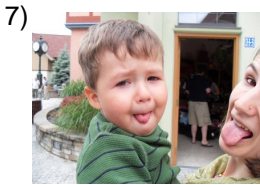
at the same time