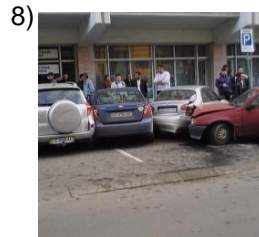
once and for all