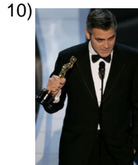
better and better _____