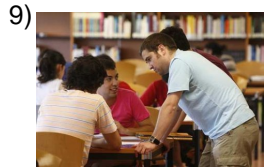
from bad to worse _____

Words to Match: alguna vez - tal vez - en vez de - tal cual vez - a veces - a la vez - de una vez - cada vez mejor - cada vez mayor - cada vez peor