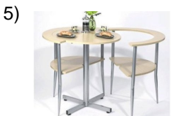
the little table