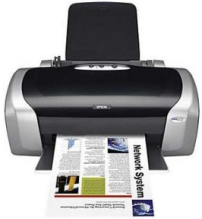
ink jet printer