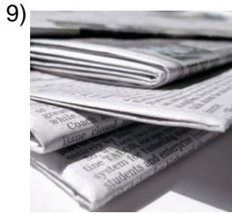
piece of news

Words to Match: imagen - la arroba - el botón - una actualización - el grupo de charla - soltar - acceso compartido - dígito - impresora de chorro de tinta - la carpeta - disco - la dirección de una página web - la libreta de direcciones - cargador - grupo de noticias - disco duro - cortar - sitio de internet - escáner - el grupo de charla - ordenar por - copiar - gráficos - abrir - la computadora portátil - unidad de disco - apagón - el monitor - guardar como - la computadora portátil - pila - explorador de web