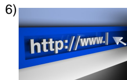
web page address