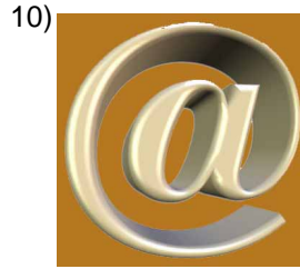
25 pounds, @ (at)