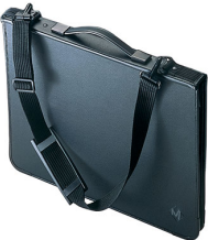
purse, pocket-book, portfolio