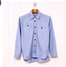
formal dress shirt