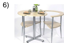
the little table