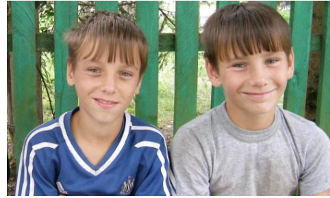
brothers or siblings