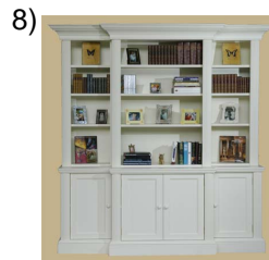
bookcase or shelves