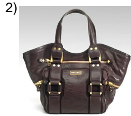
the bag, purse