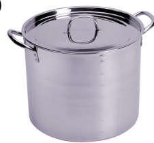
pot, cooking pot