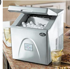
icemaker, portable cooler