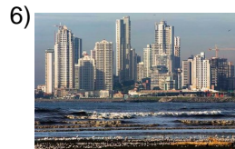
bigger and bigger