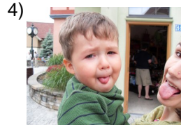
at the same time