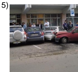
once and for all