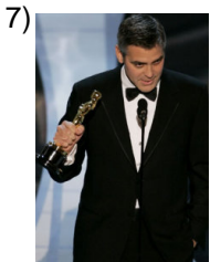
better and better