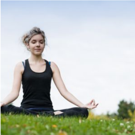
I feel very good